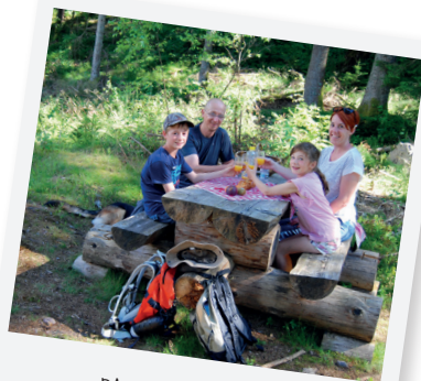
PAUSE PIQUE-NIQUE !