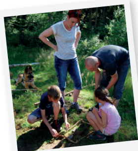
LAND'ART EN FAMILLE !