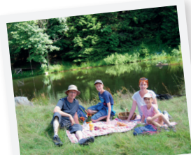
PIQUE-NIQUE EN FAMILLE !