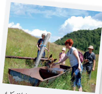
IL Y EN A POUR TOUT LE MONDE !