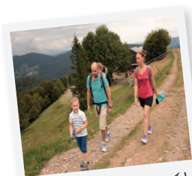
EN ROUTE VERS LE SOMMET !