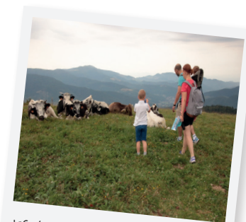
LES VACHES FONT PARTIE DU PAYSAGE