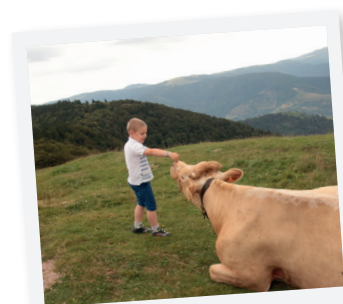
BONJOUR MADAME LA VACHE !

Ferme Auberge Le Drumont Ouvert de mi-avril au 1 er novembre, de 9 h à 23 h. Fermé tous les mardis et le lundi soir hors vacances scolaires. Tél. : 03 29 61 50 12