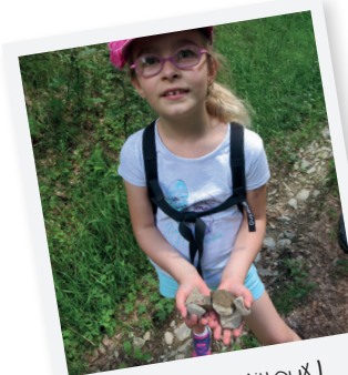
CHOUETTE DES CAILLoux !