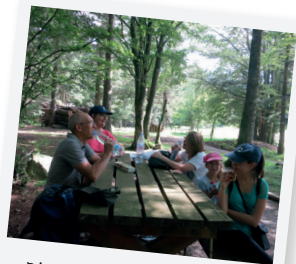
PAUSE GOUTER EN FAMILLE !