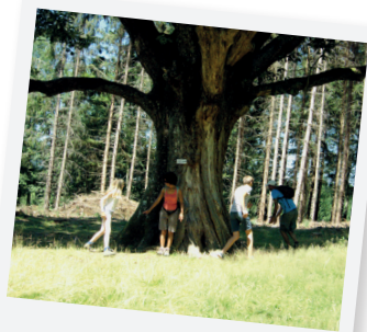
LE GROS CHÊNE