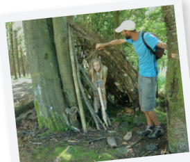
CONSTRUCTION DE CABANES