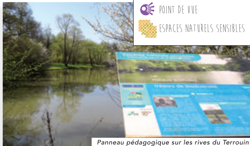
Panneau pédagogique sur les rives du Terrouin