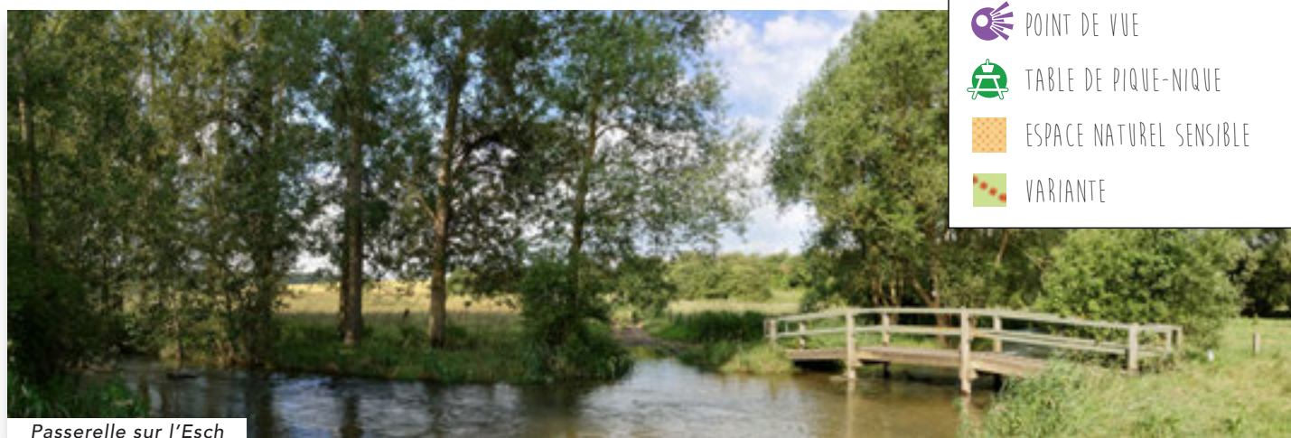
Passerelle sur l'Esch

Continuez sur 500 m et prenez à droite, à la première intersection, pour regagner Dieulouard et le point de départ.