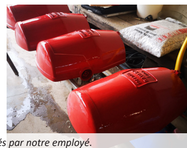
Deux exemples de travaux réalisés par notre employé.