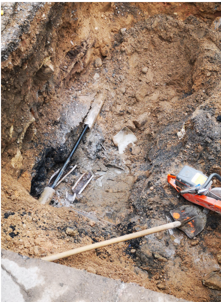
Remplacement de la conduite en gré par une conduite en PE sur 100 mètres