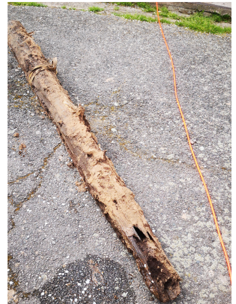
Vestige d'un passé plus ancien encore avec une conduite en bois qui alimentait les fontaines.