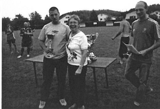
Remise de la coupe du conseil général