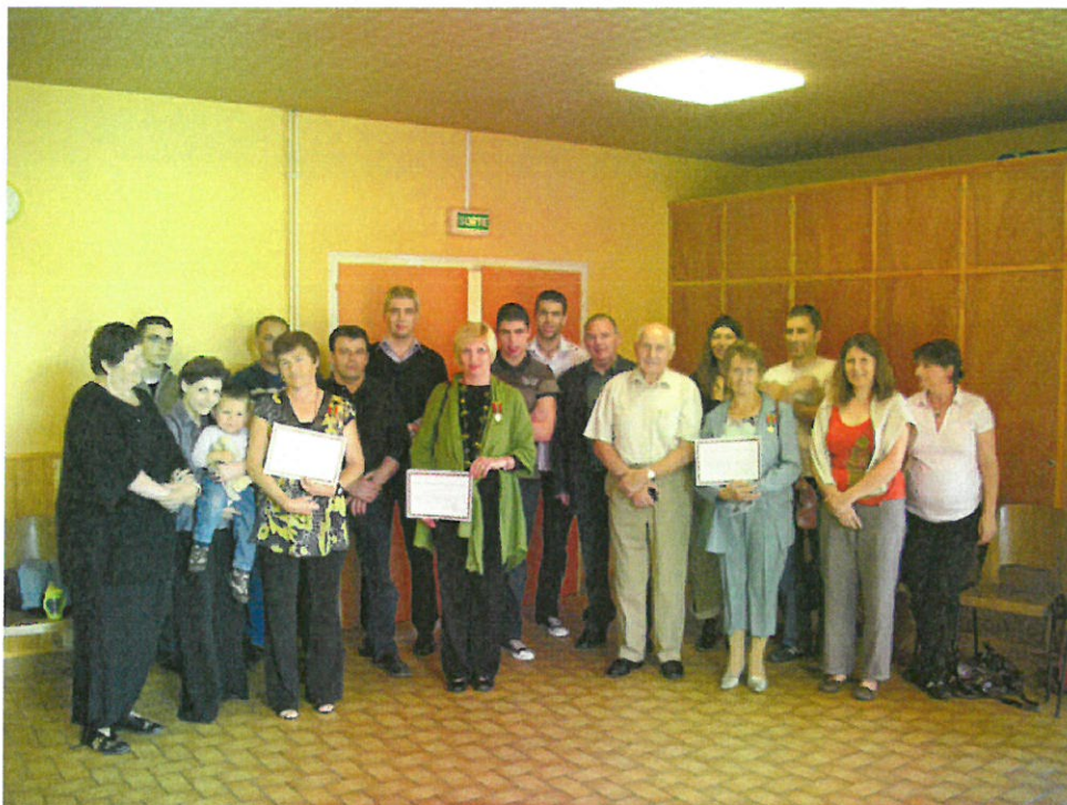
Trois mamans médaillées