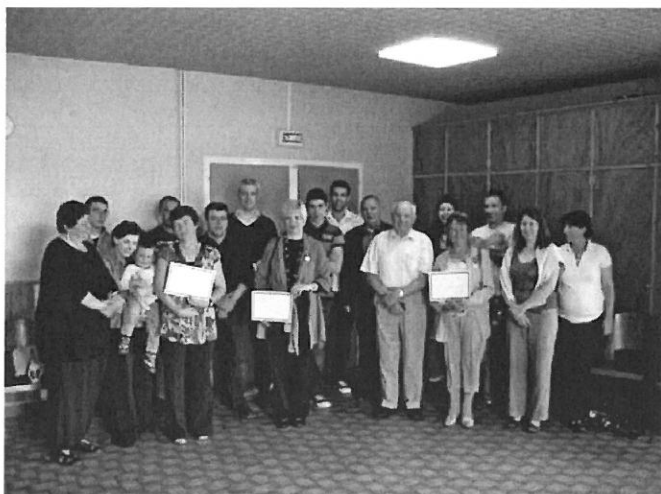
Les heureuses récipiendaires et leurs familles