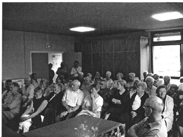
L'ADMR de Baccarat a tenu une réunion d'information dans la cité